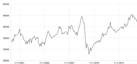
Importaciones canadienses 2002-2014