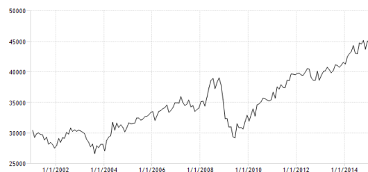
Producto Bruto Interno por habitante 2002-2014